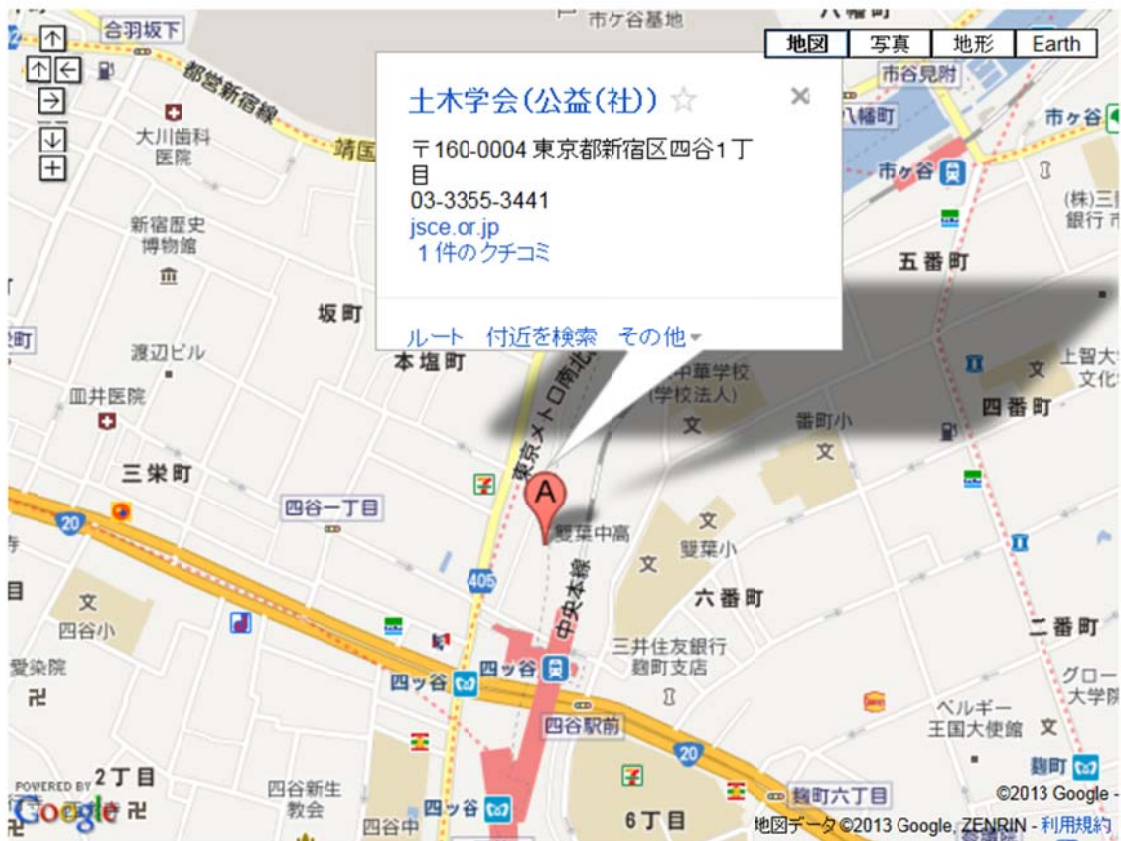
土木学会へのアクセス