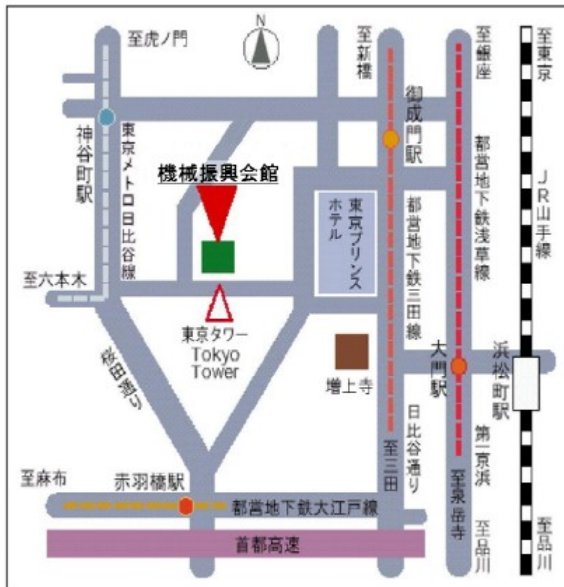
機械振興会館へのアクセス

バス：浜松町～東京タワー路線、渋谷～東京タワー路線 ※いずれも 東京タワー前下車