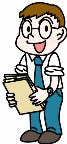
X市職員 (X大学卒業生)