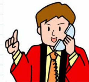
文房具店の主人 (T商店)