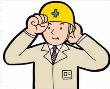
B 所長 (B建設会社)