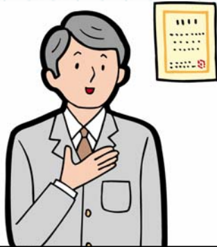
担当技術者A 発注者(R鉄道会社)