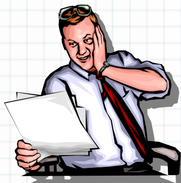
前の土地の所有者C