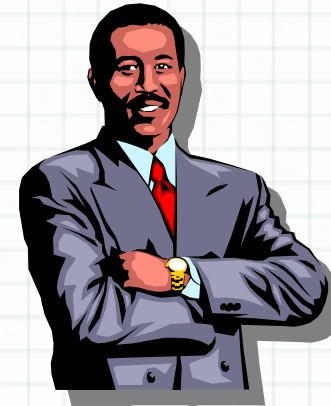
現在の土地の所有者D