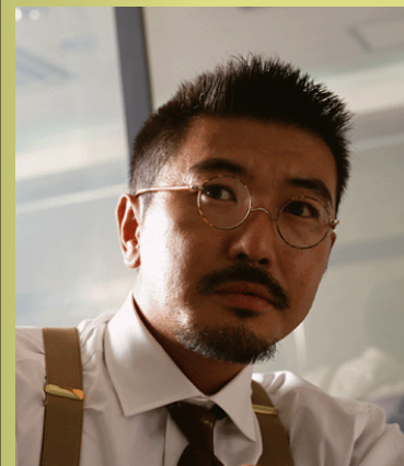
Y管理技術者 (技術士)