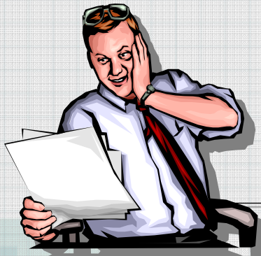
A係長 (プロジェクト担当者)