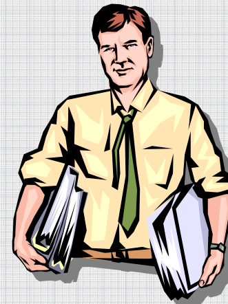
K設計長(15年目) (設計管理者)