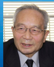
コーディネーター: 高橋 裕 (東京大学名誉教授)