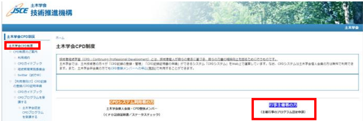
図2 土木学会 CPD 制度ページ

講習会、研修会、講演会、シンポジウムなどの主催者の方が、主催する行事等について「土木学会認定 CPD プログラム」としての認定を希望する場合は、土木学会ホームページ「CPD・資格制度」のバナーより技術推進機構のホームページを表示し、青地に白文字で示されたリンクをたどり、フォームより申請してください。