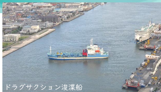
ドラグサクシオン浚渫船