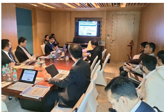
CECAR9 での TC21 特別セッション