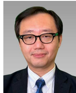
党 紀 (国際センター 留学生 グループ)

国際センター・留学生グループでは、2013 年から日本で学ぶ留学生を対象に日本の土木系企業の事業、海外プロジェクト、採用などの情報提供を目的に企業説明会を実施している。これまで毎年、東京で、隔年で関西圏で開催している。10 回目となる今回は、国際センター・外国人技術者グループ、コンサルタント委員会 グローバルシビルエンジニア研究小委員会と共催で 2022 年 12 月 10 日 (土) に開催した。昨年度に引き続きオンライン形式にて実施した。当日は全国各大学から留学生 129 名が参加し、日本企業 13 社が参加した。参加企業は以下の通りである。