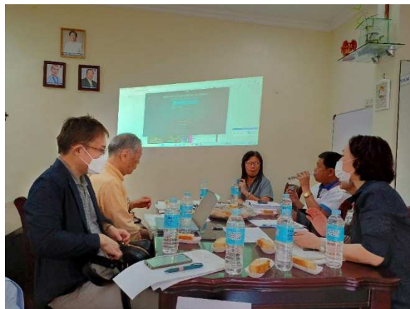
フィリピンにおける現地調査

なお、上記については、2023年3月10日に開催した第3回世界防災フォーラムのTC21特別セッションにおいて一部報告した他、今後論文等で発表していく予定である。