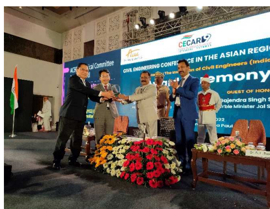
ACECC TC 賞受賞