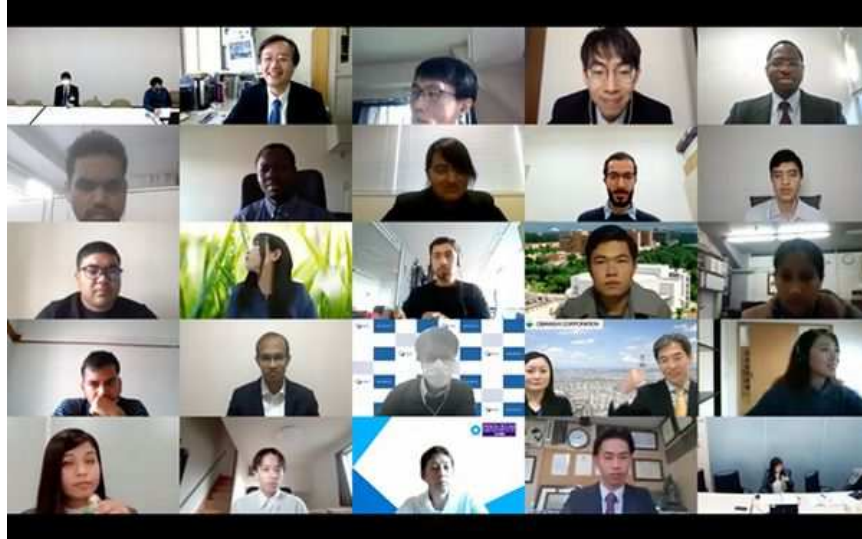
写真2 企業1分PRを行う代表者と参加者

そして、第2部 企業セッションが始まった。ここでは14時から17時15分までの間、各社4セッション(1セッション・20分)を行い、留学生は最大8セッションへの参加が可能であった。事前に留学生に企業セッション・タイムテーブルと各企業セッションのリンクを通知していたため、留学生はスムーズに企業セッションに出入りができ、関心ある企業のセッションに参加して情報を収集していた。時間帯によって参加者数に変動はあったが、17時15分の終了時間まで、いずれのセッションも参加者が途絶えることはなかった(表1)。