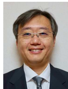
党 紀 (国際センター 留学生グループ)

国際センター・留学生グループでは、2013年から日本で学ぶ留学生を対象に日本の土木関連企業の事業、海外プロジェクト、人事採用などの情報提供を目的に企業説明会を実施している。これまで東京にて毎年、関西圏にて隔年で開催している。第8回となる今回、当初は東京にて例年通り対面形式による実施を予定していたが、コロナ禍の状況を鑑み、オンライン形式にて2020年12月12日(土)に開催した。初の試みであった。