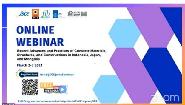
Zoomによるオンラインセミナー