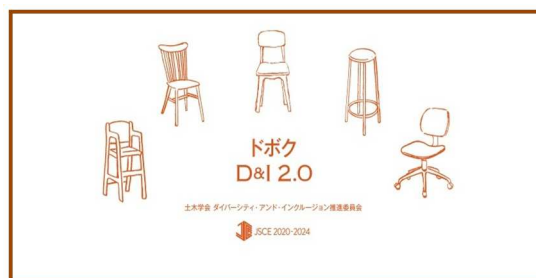
D & I カフェトーク