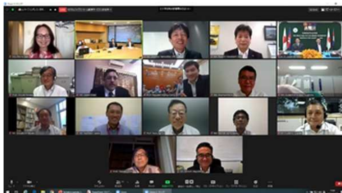
土木学会国際貢献賞お祝いの会 (2020年8月27日)