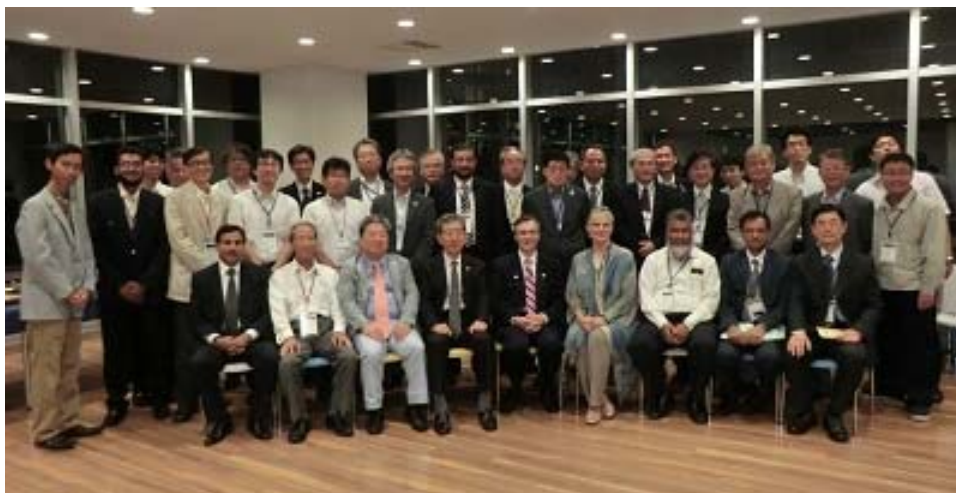
2013 年全国大会海外ゲストとの記念写真 日本大学生産工学部会場にて