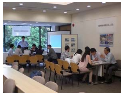
企業ブースでの説明

説明会は、留学生と企業のマッチングの場として、双方に大変好評でした。しかしまだ、日本企業の留学生への認知度は低く、また採用条件も採用数が少ないこともあり、必要な日本語レベルも含め明確でなく、留学生にとっては理解しやすい状態とは言えません。留学生グループでは、参加者からのご意見を反映させるなど、開催方法を改善しながら継続的（年1回程度）に企業説明会を開催することで、留学生と企業がコミュニケーションできる場を提供していきます。