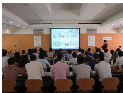
企業のプレゼンの様子

(株) エイト日本技術開発、(株) 大林組、(株) 片平エンジニアリング・インターナショナル、(株) 片平エンジニアリング、基礎地盤コンサルタンツ (株)、清水建設 (株)、大成建設 (株)、大日本土木 (株)、(株) 長大、戸田建設 (株)、西松建設 (株)、日本工営 (株)