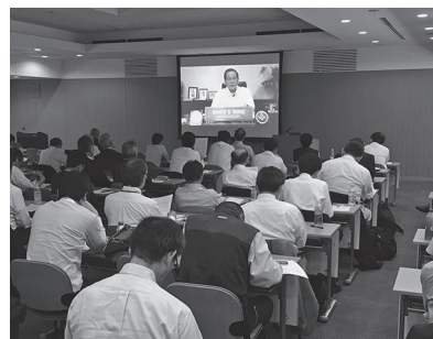
Momo事務次官のビデオメッセージに聞き入る聴衆

好評のシンポジウムが、「水害から市民を守る「フィリピン国オルモック市洪水対策プロジェクト」と題して、2017年5月16日、土木会館講堂において開催された。