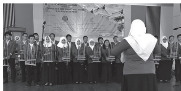
ITBの学生によるアンクルンの演奏

今回セミナーを開催したITBのキャンパス整備では、1990年から日本のODA事業が実施されている。このため、今回のテーマ