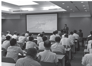
10回目を迎えたシンポジウム

2014年4月に始まった「世界で活躍する日本の土木技術者シリーズ」のシンポジウムが10回目を迎えた。今回は、「ベトナム最長の海上橋建設