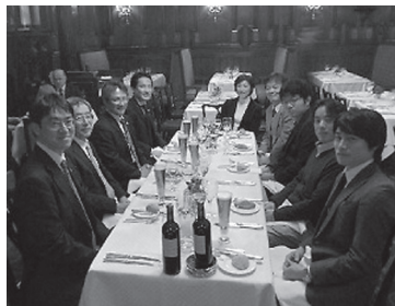
英国分会との交流会

2013年11月4日～7日の間で、土木学会100周年記念行事への出席および国際セッションへの発表者の依頼を主な目的として、英国土木学会、オランダ王立工学会を訪問しました。