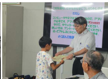
地下空間博士認定授与（大阪）