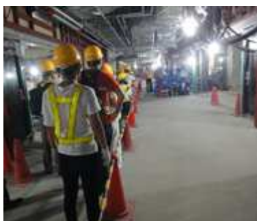
現場見学地下部（東京）