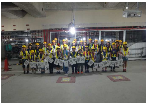
参加者の集合写真（東京）