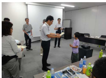
地下空間博士認定授与（東京）