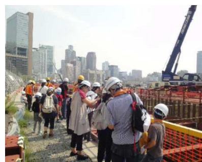
現場見学トンネル上部（大阪）