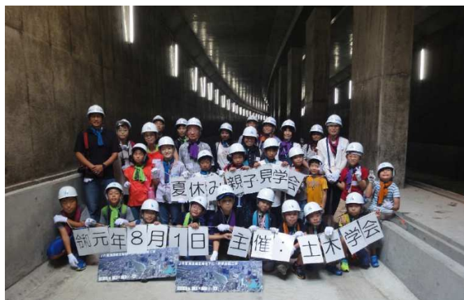
参加者の集合写真（大阪）