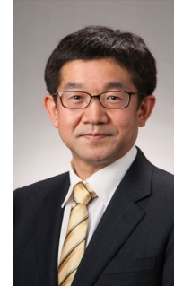
越川信一氏 銚子市長 生年 1961年生まれ(63歳) 略歴 昭和60年3月 慶應義塾大学経済学部卒業 平成19年5月 銚子市議会議員 平成25年5月 銚子市長就任(1期目) 29年5月 銚子市長(2期目) 令和 3年5月 銚子市長(3期目) 座右の銘 静かな情熱 趣味 演劇、コーラス