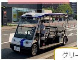
グリーンスロー モビリティ展示