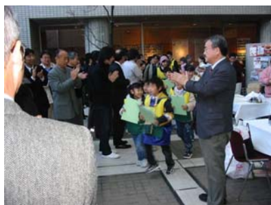
写真 1：ぼうさい探検隊出発の様子

時は、NPO 法人とも協働関係を結び、小学生を主体とした、「子供たちによるぼうさい探検隊」を結成し、東京の街並みを防災の視点で調査等の活動を行いまし