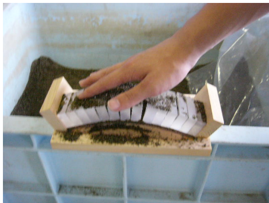
図1. ブロックと砂を用いたアーチ橋模型

筆者が小学校における出前授業の教材として作成した最初のアーチ橋模型は、図1に示したようなアクリルブロックと砂を用いたものであった。木製の台にアクリル板を嵌め込み、アーチ状になったアクリル板上にアクリルブロックを並べ、ブロックの隙間に砂を充填した後アクリル板を抜き取ると、アクリルブロックと砂のアーチ橋が完成する。平成19年2月に日光市立落合東小学校で実施した出前授業で用いた教材であり、体験型の授業を行うために活用した。受講した小学生の反応や小学校の先生方の評価を総合すると、小学生用の学習教材としては一定の成果が得られたものと考えている。