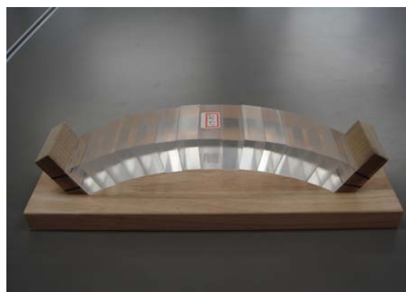
図4. 円弧近似によるアーチ橋の模型