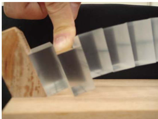
図2. 放物線近似によるアーチ橋の模型

一方で、砂を使用するため準備と後片付けに手間がかかり、この点に教材としての改善の余地が残されていた。そこで筆者は、砂を使わないアクリルブロックのみの模型作成を目指し、折からスタートした本学と足利工業高校との高大連携教育プログラムの指導テーマとして活用することとした。