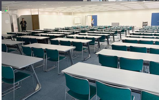
収容人数約150名の大会議室