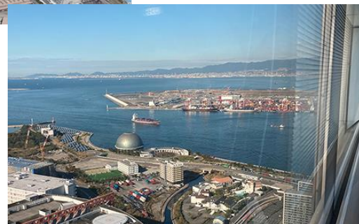
44階からは建設中の夢洲が眺望できる