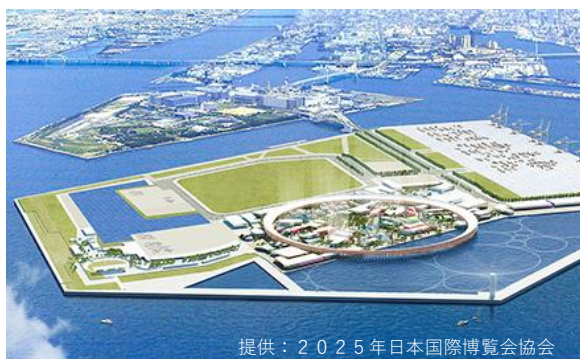
大阪・関西万博の会場イメージ

本小委員会では、毎年8月に一般市民を対象とした夏期講習会を開催している。その時の社会的背景に合わせてテーマを設定し、講演会や見学会などを開催してきており、第55回目となる令和6年度は、令和7年開催の大阪・関西万博や日本初のIR（統合型リゾート）の開発計画が進む夢洲を中心としたテーマを設定し、万博に関する講演の他、夢洲で進む開発計画についての講演を企画している。夢洲では、大阪府・大阪市を中心として、民間事業者の提案も参考にしながら、平成29年に「夢洲まちづくり構想」が策定され、令和元年には、同構想をもとに、夢洲まちづくりの方向性を示す「夢洲まちづくり基本方針」がとりまとめられた。本講習会を実施することで、開催が迫る大阪・関西万博や夢洲のまちづくりにおける機運醸成を図る等、夢洲を中心とした大阪の都市計画及びまちづくり行政の推進に寄与することを目的としている。