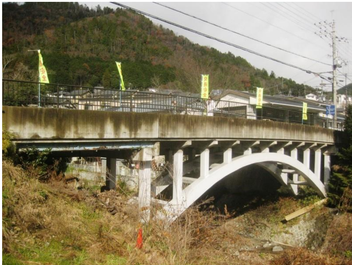
市原人道橋 ／(旧)市原橋