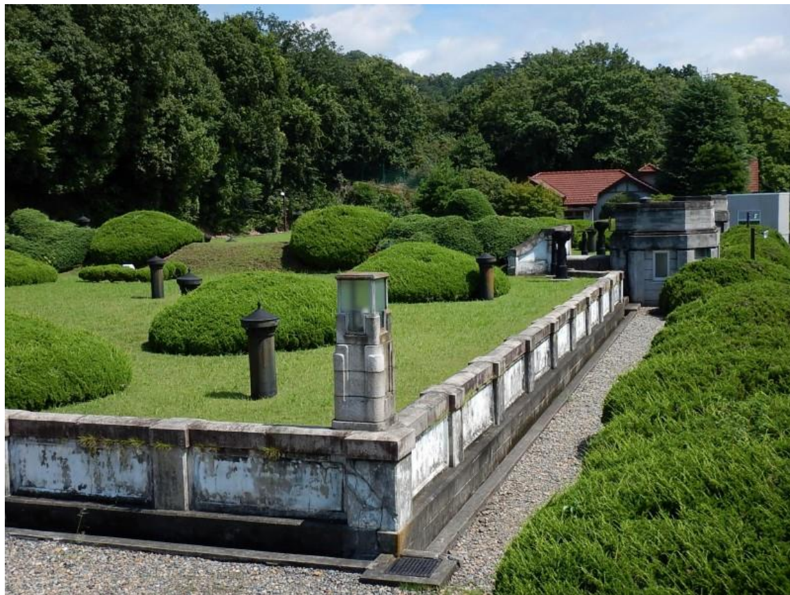
足利市近代水道施設群