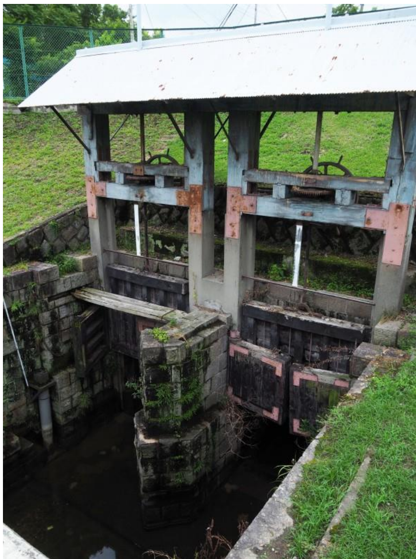
庄内用水元杵樋門