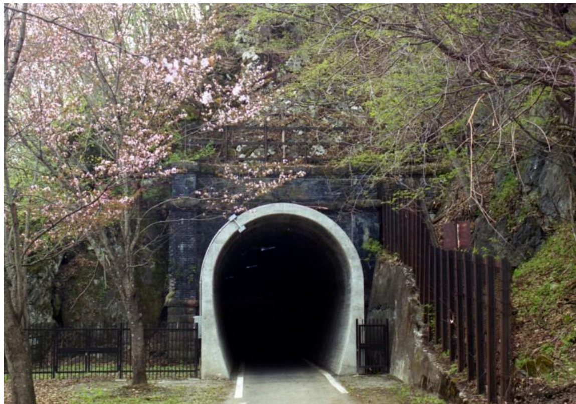
北海道官設鉄道神居古潭トンネル群