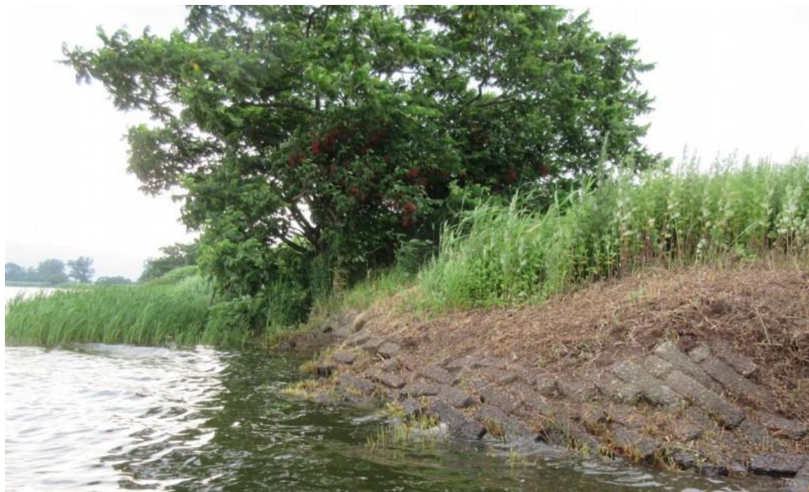
茨戸川の岡崎式単床ブロック護岸