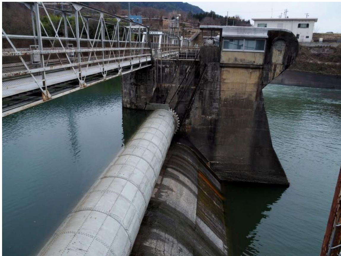
南向発電所取水堰堤