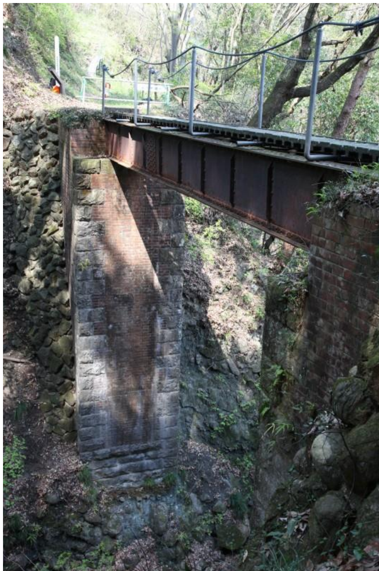
旧上野鉄道鬼ヶ沢橋梁