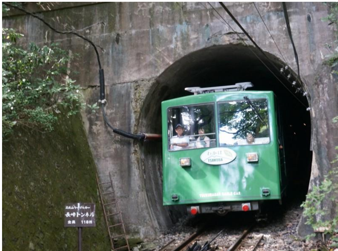
筑波山ケーブルカー