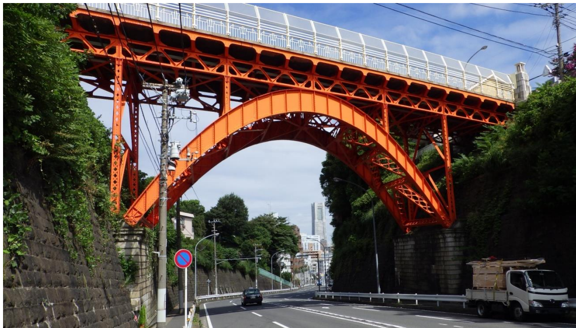
元町・山手地区の震災復興施設群