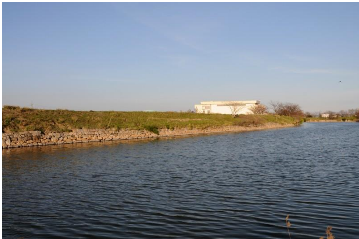
百間川の治水施設群――一ノ荒手、二ノ荒手、米田の旧堤防、大水尾の旧堤

ひゃっけんがわのちすいしせつぐん―いちのあらて、にのあらて、よねだのきゅうていぼう、 おおみおのきゅうてい