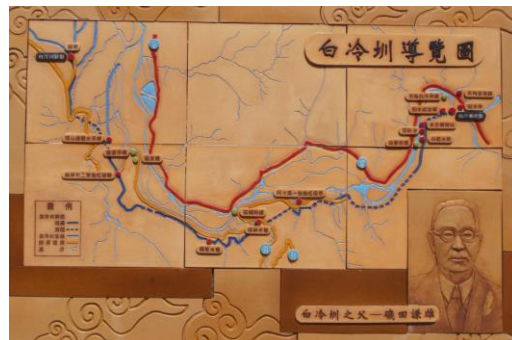
磯田技師の影像と白冷圳説明パネル