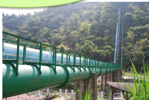
白冷圳の逆サイホン水管

施工1900年 西郷隆盛と愛子(愛加那)の子として奄美大島で 生まれた西郷菊次郎(1861～1921)が、初代宜蘭庁長の時、 毎年氾濫を起こす宜蘭河治水工事をし、水害の根絶を図る。