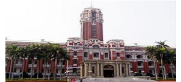
◀総統府▶ 日本統治を知るうえで見逃せない建造物

日本国パスポートの場合、台湾入国時に残存有効 期間が3ヶ月以上必要です。ご注意ください。