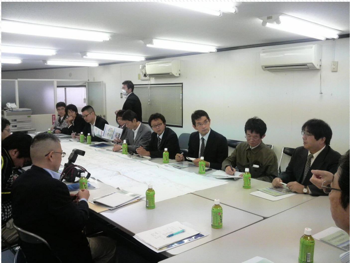
東北縦貫線 現場事務所での説明