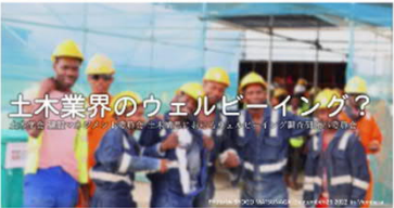
運営しているクリエイター 公益社団法人土木学会【土木学会WEB情報誌『from DOBOKU』～土木への偏った愛～