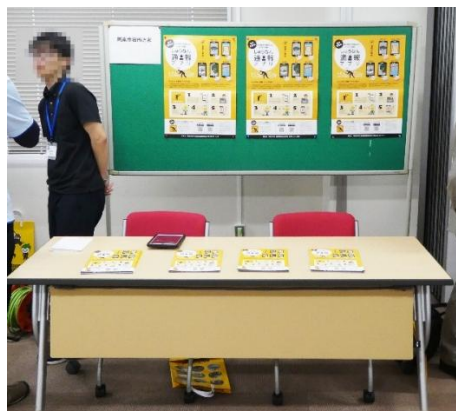
写真-1 ブースイメージ