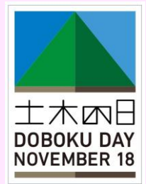
2023年度「身近な土木を描いてみよう!」図画コンクール優秀賞作品より