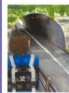
第16回「身近な土木を描いてみよう!」図画コンクール