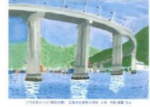
第16回「身近な土木を描いてみよう!」図画コンクール 2024年カレンダー