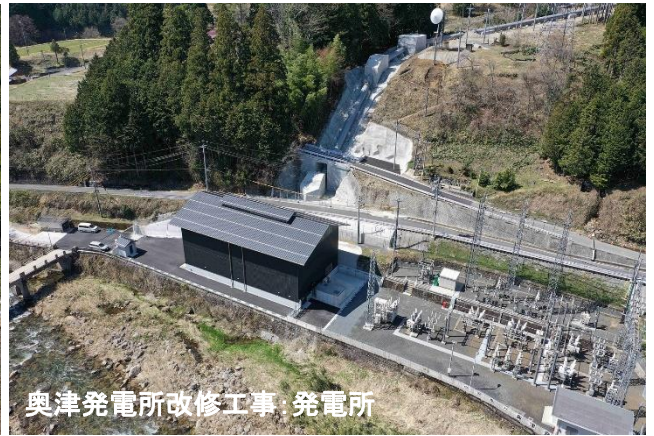
奥津発電所改修工事：発電所