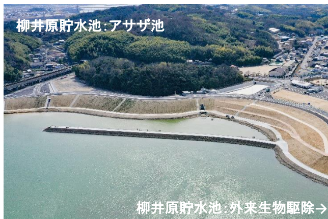
柳井原貯水池：アサザ池