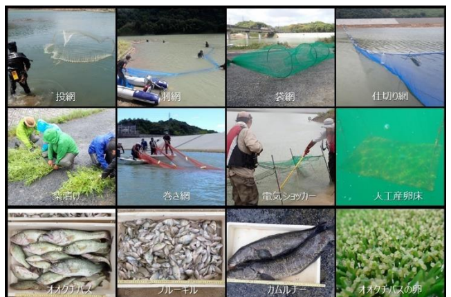
柳井原貯水池：外来生物駆除→