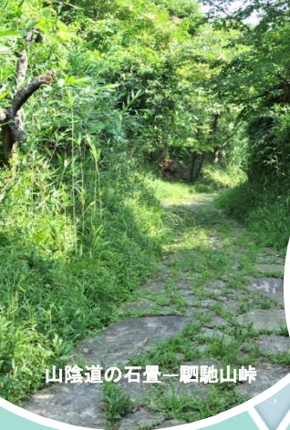
山陰道の石畳一駟馳山峠