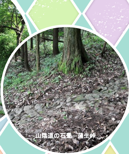
山陰道の石畳一蒲生峠