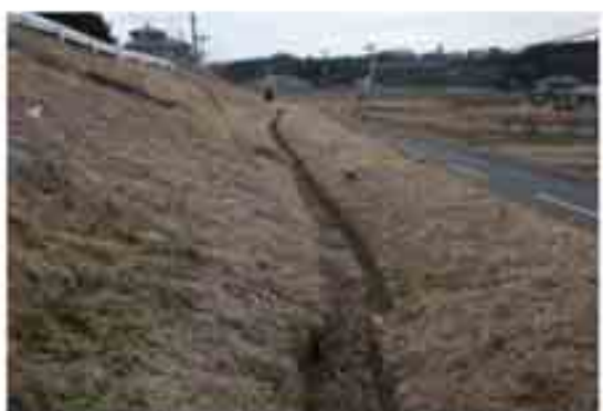
18 盛土のはらみだし