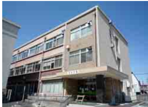
写真-2(1)② 福島県北分庁舎(郡山市)全景