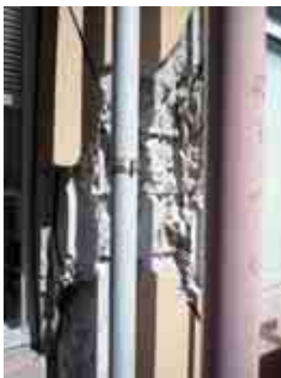
写真-2(2)② 福島県北分庁舎(郡山市) 1F 柱のせん断破壊(主筋は丸鋼)