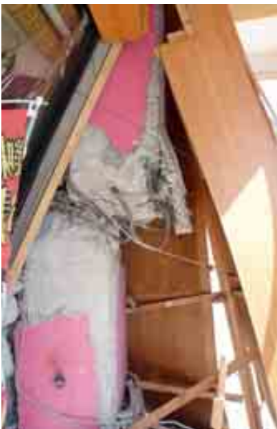
写真-4(2)④ 回転ずし店舗の崩壊 (RC柱のせん断破壊)