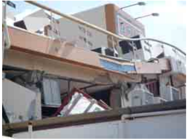
写真-4(1)④ 回転ずし店舗の崩壊 (RC柱のせん断破壊)