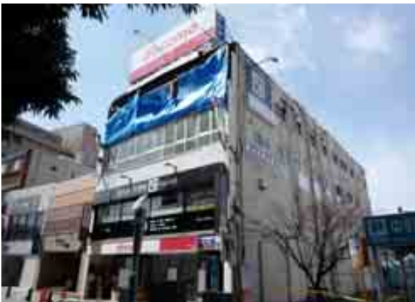
写真-1① 百貨店うすい前の建物 全面の壁の崩落