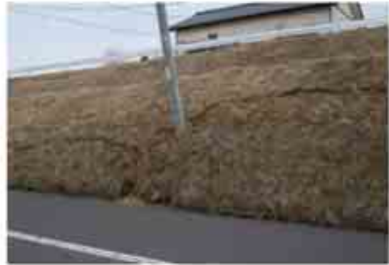
16 住宅団地の盛土のはらみだし