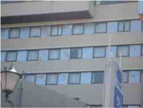
写真-3③ホテルはまつの客室壁のせん断破壊