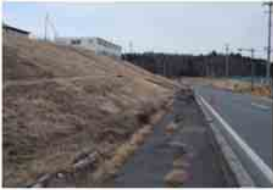
13 工場盛土のすべり（調整池（写真右）方向へのすべり）