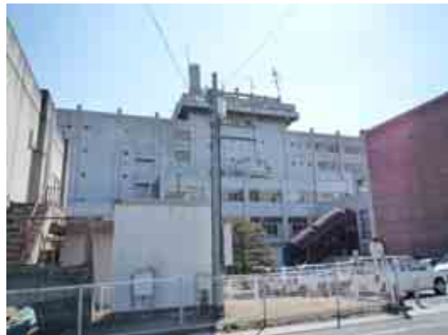
写真-5⑤ 市役所のペントハウスの2,3階の崩壊 中間の水槽タンクの崩壊(気象庁震度計とあわせて)