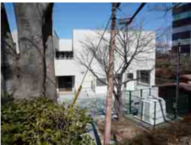
写真-6⑥ 開成公園内のk-net 郡山(市役所前)