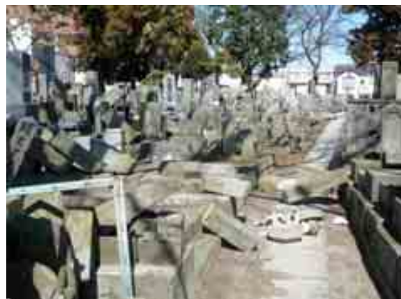
写真-2(3)② 福島県北分庁舎(郡山市)周辺の 如實寺の墓石(9割程度転落)