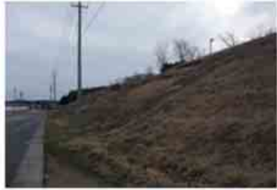
14 工場盛土のすべり（上段部ですべり）