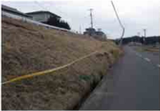
15 住宅団地の盛土のはらみだし