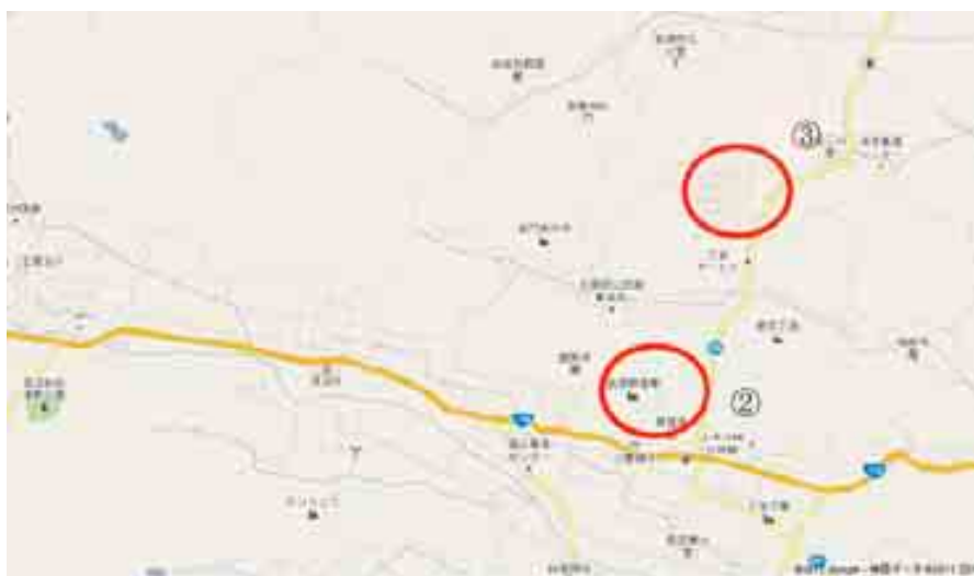
調査位置図 (グーグル)

郡山周辺でもガソリンを入手することは困難であるため，今後の調査継続は困難である。