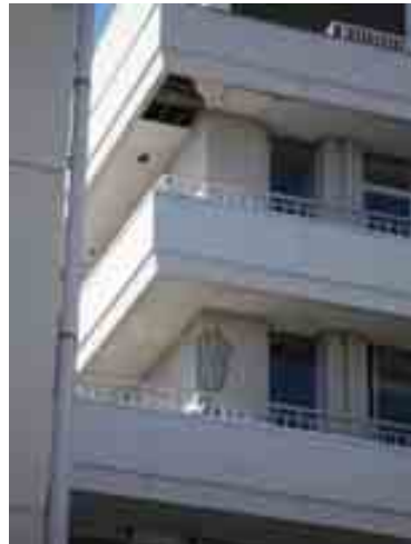
写真-7⑦郡山市中央公民館 (RC柱のせん断破壊)