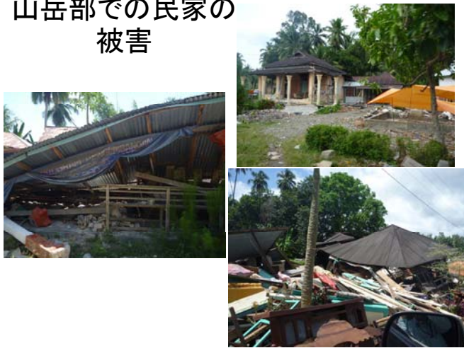
山岳部での民家の被害