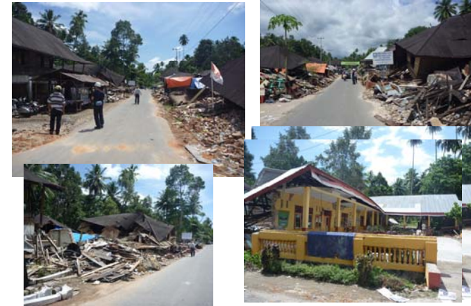
山岳部での民家などの被害