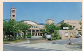
鶴田町 国際交流館