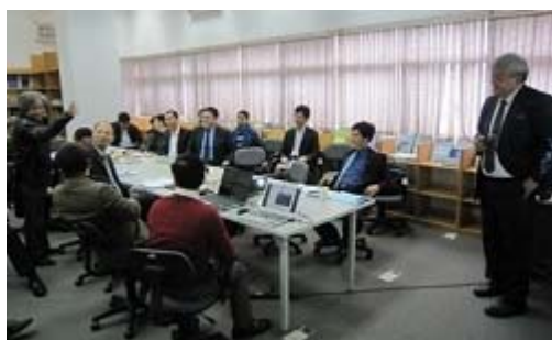
円卓会議における舗装技術セッション

日越土木技術セミナーは今回で2回目となりましたが、講演中及び質疑時間において学生の真剣かつ積極的な姿勢を感じました。また、講演内容が基本的な内容でしたので、参加者の我が国における ITS、舗装技術に対する理解が高まったものと確信しました。