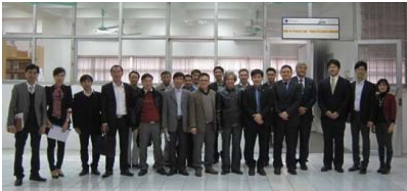
円卓会議の参加者 日越土木技術者協力促進センター図書室前

円卓会議では、軟弱地盤対策、舗装技術ともにベトナム側の関心が高いテーマであり、大学、関係省庁、民間の専門家による会議であったことから、各々具体的な事象に基づき、非常に熱心な議論が繰り広げられました。このような少人数の専門家同士の情報交換は、今後とも定期的に開催することが有意義です。