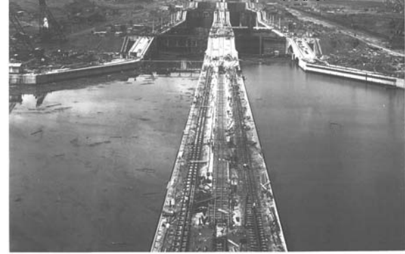
青山士設計 ガトゥン閘門 中央隔壁アップ ローチ・ウォール(下流側)