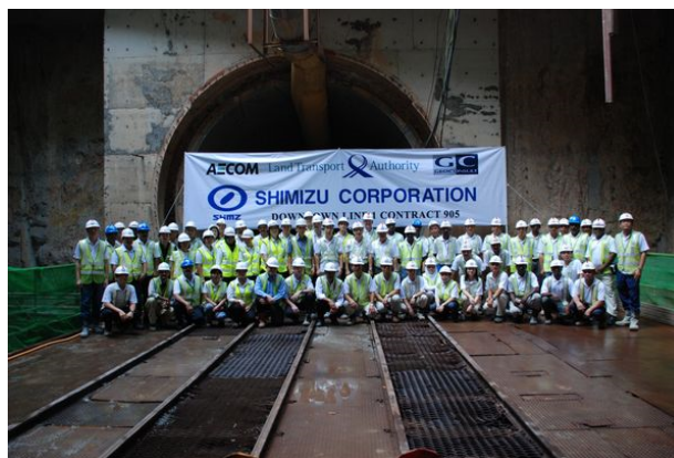
写真1 シンガポール地下鉄海底トンネル工事の設計責任者として

2007年4月に国際支店土木技術部へ移り、シンガポール勤務になりました。初めての海外プロジェクトでは、シンガポール観光名所のマリーナベイサンズにつながる地下鉄の海底トンネル工事に取り組み、設計責任者を務めました。(写真1)。日本の高水準の技術力を活かし、難地盤での立坑やトンネル施工の困難を克服し、工事を竣工することができました。世界中から優秀な人材が集まるシンガポールの職場環境に対応したことで、ダイバーシティを理解し、異文化組織の動機付け及びチームワークづくりは工事の成功に欠かせない要素であると実感しました。