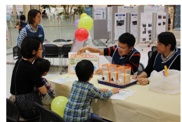
強いトンネルの実験