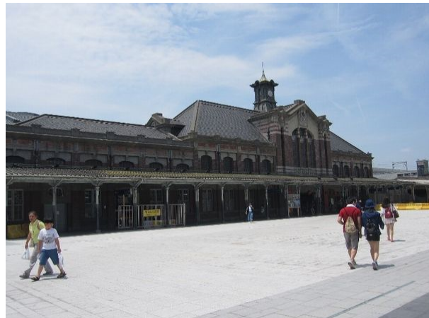
新しい台中駅と歴史的な旧台中駅

若手セッションの目的でもある国際チームワークが日台にかかわらず他の国々でも重要であることは明らかであり、国際センターとしても来年(2019)のCECAR8でも若手セッションを開催する予定である。言うまでもなく日台これからの交流も重要であり、来年もワークショップが日本で開催される予定である。