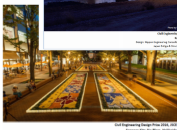
グリーティングカード

この賞は、土木学会の景観デザイン委員会が運営しており、様々な分野の専門家の審査員が実際に現地調査をした上で選考しています。この賞の特徴の一つとして、完成後1年を経ないと応募できない、という点があります。つまりできた直後が美しいかどうかではなく、少なくとも1年四季を過ごし、風雨や利用の影響を踏まえた上で評価することが、インフラや公共空間のデザインには必要と考えるためです。また作品に関わった個人を特定して表彰する点も特徴です。