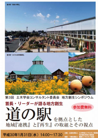
第3回 土木学会コンサルタント委員会 地方創生シンポジウム 首長・リーダーが語る地方創生 参加費無料 道の駅 を拠点とした 地域『連携』と『再生』の取組とその視点 平成30年1月31日(水) 14:00~17:30

「地方創生」をけん引するリーダーを招き、シンポジウムを開催しています。第3回シンポジウムでは、首長・リーダーが語る地方創生：道の駅を拠点とした地域「連携」と「再生」の取組とその視点をテーマとして、東京近郊で、際立って元気な取組を続けている道の駅「とみうら」と「保田小学校」を取上げました。「とみうら」は、永きにわたり周辺地域や農業との連携により活性化を図り、保田小学校は廃校を再生活用したプロジェクトとして知られています。その「成功」と言われる事例の実態を把握し、インフラ整備・保全の観点から地方創生を学ぶとともに、インフラ技術者に向けられる期待、インフラ技術者が果たす役割などについて討議しました。