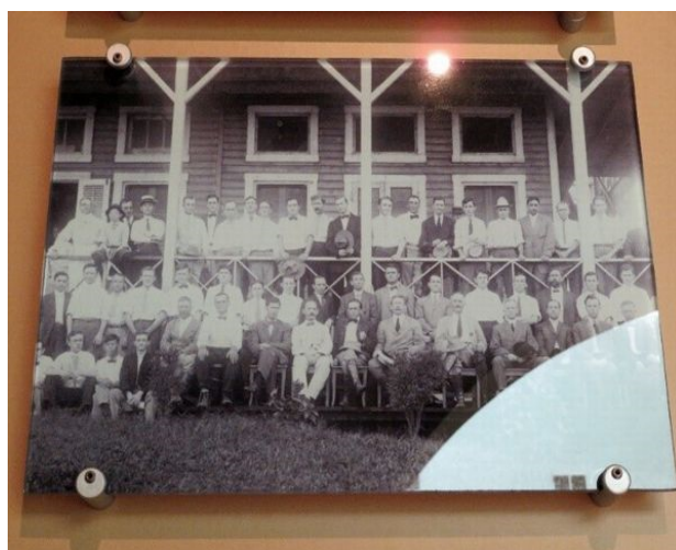
運河建設に携わった技術者の集合写真 (写真の前列左から3人目が青山士氏)

5月初旬にパナマ市で開催された国際航路協会(PIANC)の年次総会と4年に一度開催の国際航路会議に出席し、会議の後のテクニカルツアーで、パナマ運河の旧閘門と一昨年開通した新閘門、並びに運河博物館等を訪れる機会を得ました。運河博物館には旧閘門の建設に携わった、当時の技術者の集合写真が飾られており、その中に青山氏の姿を発見したときは感無量でした(写真)。青山氏の足跡は土木学会の「土木人物アーカイブス」に取り纏められていますが、現地においてその足跡をこの目で見る事ができたことは、大きな宝です。