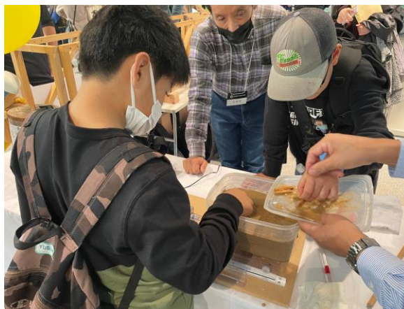
振動装置を用いた液状化現象の再現