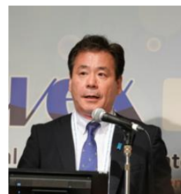
こやり 隆史政務官

7/8の開会式後のプレナリー（基調講演）において、こやり隆史国土交通大臣政務官が講演しました。国土交通省の取組みとして、気候変動の将来予測データを活用した治水対策と気象予測データを活用したハイブリッドダム