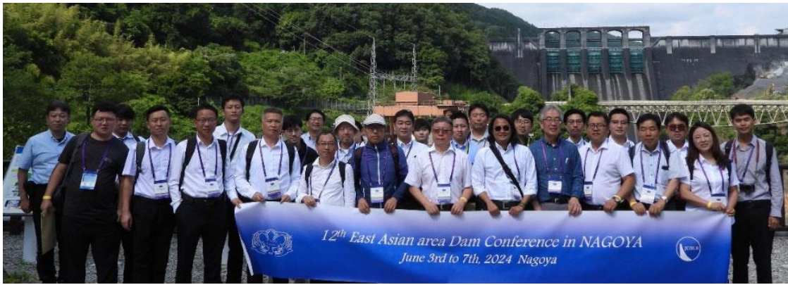
図-2 技術ツアー、新丸山ダムにて