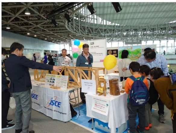
サイエンスアゴラ 2023 での出展ブースの様子

ブースへの 2 日間の来場者は、100 組以上となった。来場者のアンケート結果からは、「身近なところに木材を増やしてほしい」、「花粉症なので特にスギを活用してほしい」といった、土木分野での木材利用について前向きな意見を多くいただいた。また、「今後の日本に必要な技術を知ることができて嬉しい」、「木材の面白い説明が聞けた」、「意外と木材が余っていることを知らなかった」などの意見もあり、通常の学会活動では出会えない方々とも積極的な交流ができ、委員会の活動内容を知ってもらう機会として大きな意義があった。