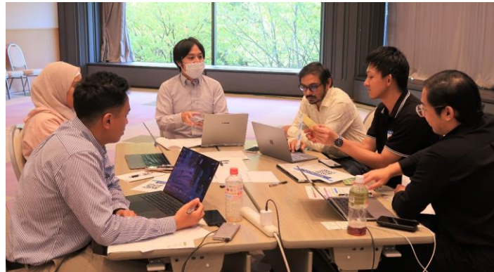
写真2 課題について熱心に意見交換する参加者