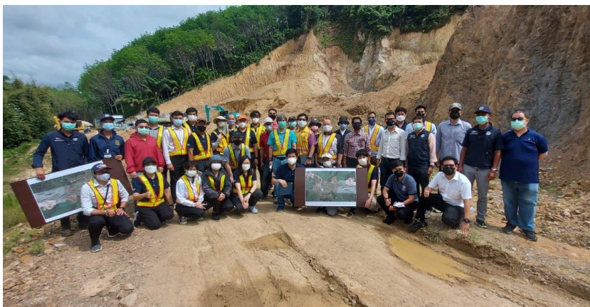
クラビバイパスのトンネル予定地付近（2022年3月）

タイ国の道路トンネル事業はまだ入り口の段階です。今後、タイ南部クラビのバイパス建設プロジェクトが、DOH にとっての最初の山岳トンネル建設プロジェクトとなると思います。このプロジェクトには先述のパイロットプロジェクトとして JICA チームも関与しました。クラビバイパスプロジェクトを端緒として、今後も日・タイの交流が継続、進展するような環境づくりを引き続き行ってまいります。