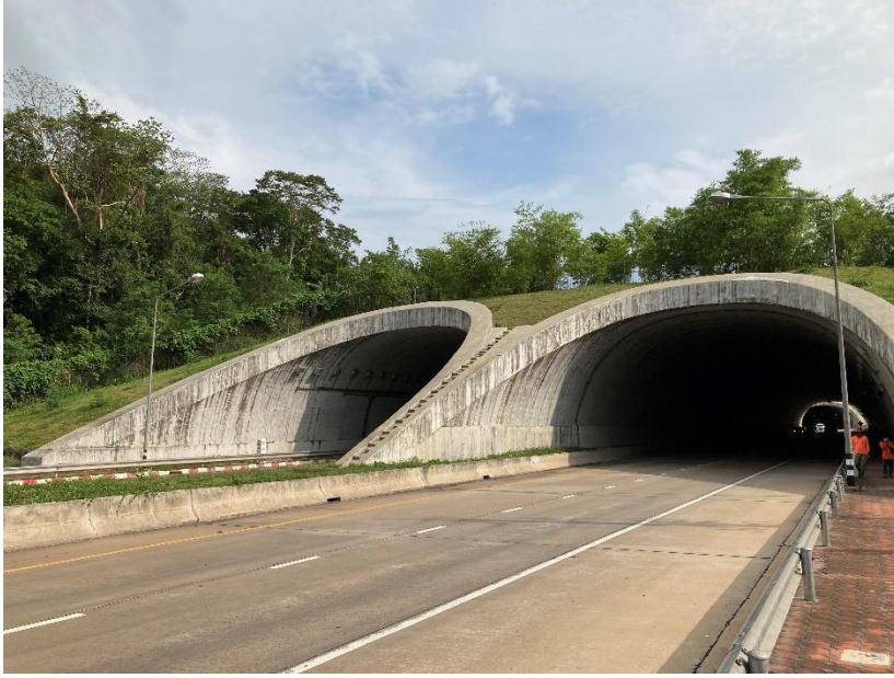
国道 304 号の開削工法で建設された道路トンネル