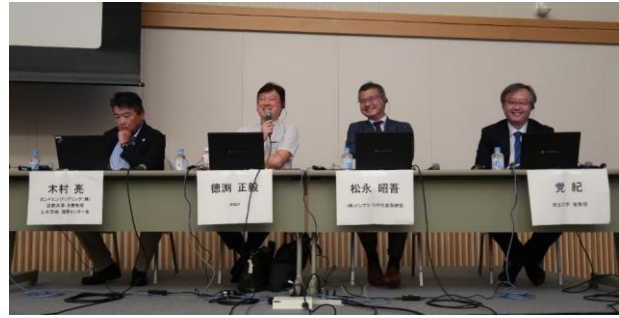
写真1 国際関連特別講演会