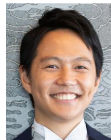
岡地 寛季 (北海道大学大学院 工学研究院 特任教授)