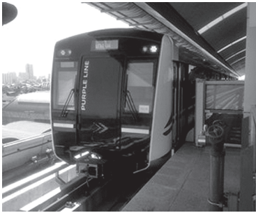
タイ・バンコク MRT パープルラインプロジェクト

国際センターでは、毎月和文と英文で「国際センター通信」をメール配信し、土木学会の活動を国内外に発信している。国際センター発足当時から発行し、2018年5月号で第67号となった。