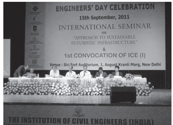
写真1 土木学会による特別セッション

写真1に示す通り、Siri Fort Auditorium はこの日の催しにふさわしいたいへん立派な施設であった。講演者には花束や記念品の贈呈があり、たいへん丁寧に扱われた。インドはもとより、ア