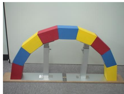
支保工（片側）の補修を実施