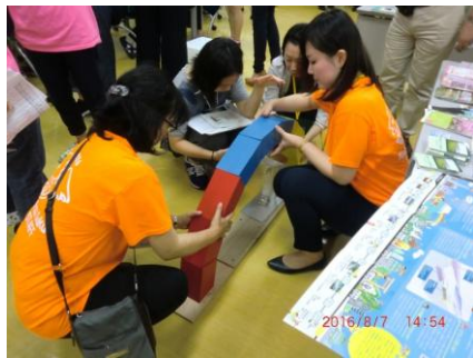
(a) 土木技術者女性の会