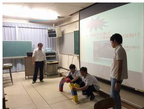
体験型実験の様子