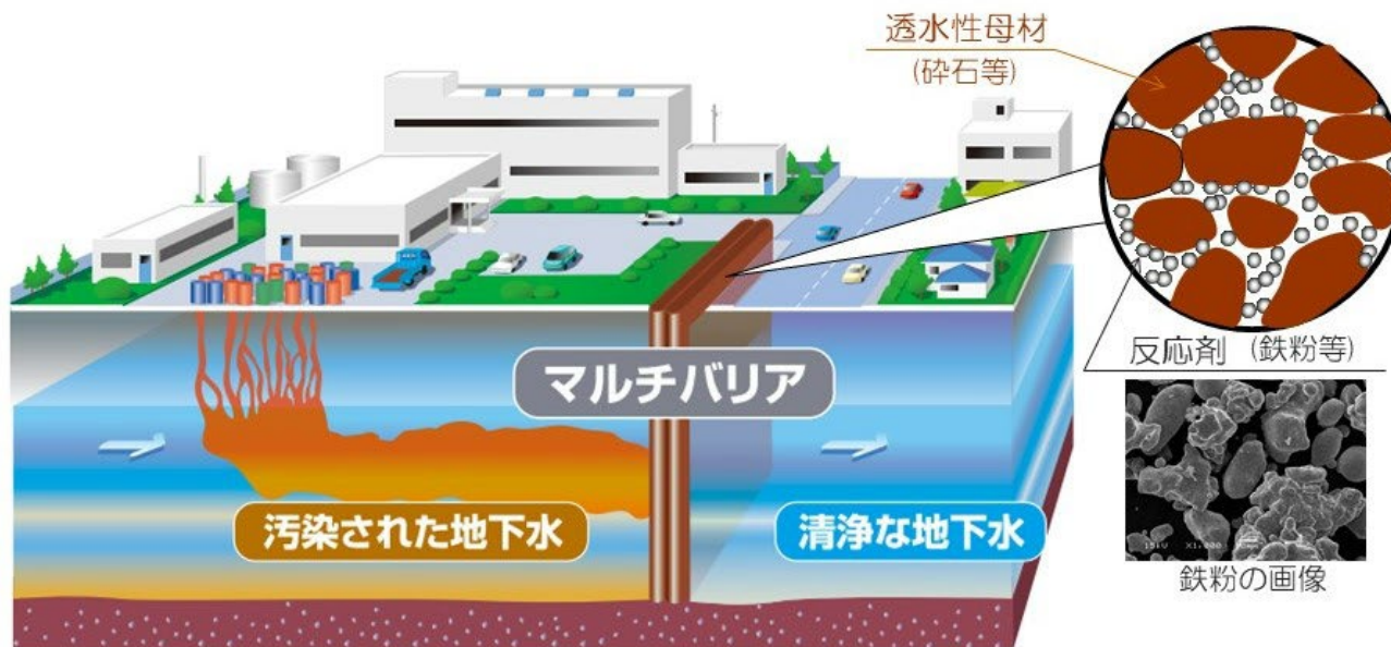
画像1：マルチバリア技術の概念図