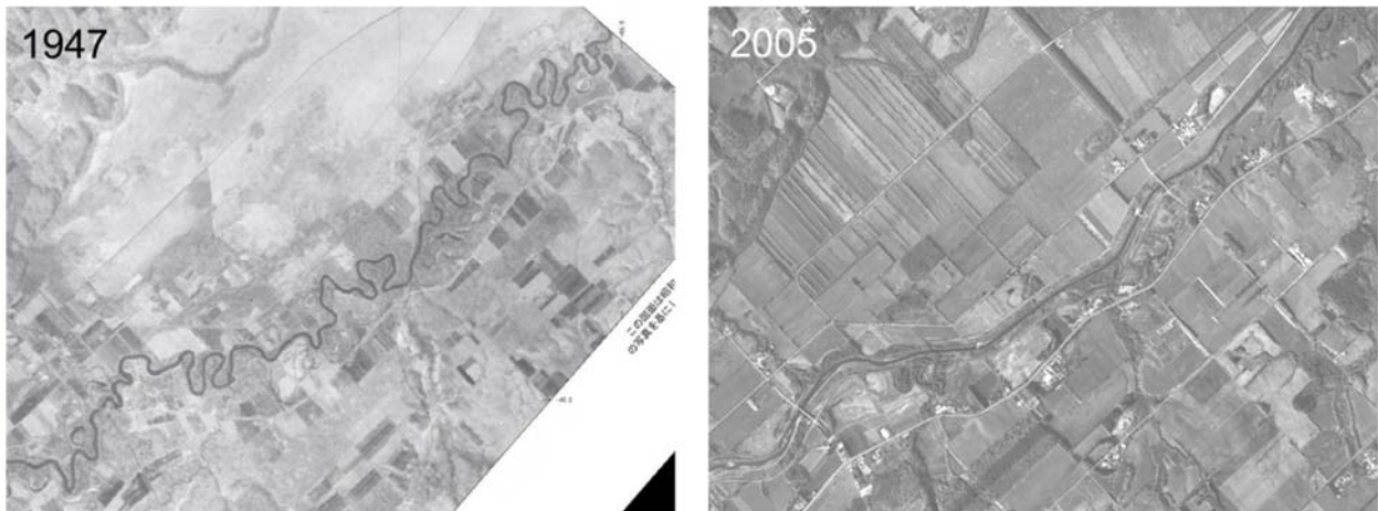
図1 標津川における蛇行河川の直線化

蛇行していた北海道の河川が、捷水路工事と築堤工事によって直線化され、大きな変貌を遂げたのは、戦後の高度経済成長期、1950~1960年代であろう（図1）。北海道におけるこの時代の捷水路工事は、治水目的の他、河川の両側に広がる泥炭地を乾燥化し田畑として利用する目的もあった。捷水路工事は流路延長を短くし、河床勾配を急にするため、一般的に流速が増大し河床が掘れて低下する。この低下した河床に連動して、周辺地域の地下水位も下がり、農地として利用することが可能になったのである。こうした歴史的背景を経て、日本の蛇行した河川は直線化され、治水の安全度は向上し、周辺地域の集約的な土地利用が可能になった。