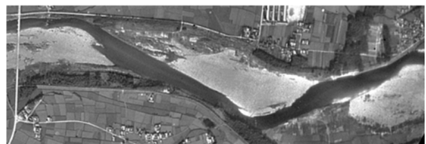
(a) 1947年10月

この植生動態モデルは図-2に示す枠組みで構成される。河川地先の河道断面を対象にしたサブモデル群(①~④)と、河川水系の河道ネットワークモデル(⊙)からなる。前者のモデル群では、樹林化に至る機構を①河川流量、②河川流動、③河床形状、④植生生態の相互作用がおりなす確率過程と考え、砂州上の長期間に渡る樹木消長が評価される。一方、後者のネットワークモデル(⊙)は流域の流量集積特性を①~④の各サブモデルに反映させる役割をもち、植生動態モデルが水系全体に展開される。具体的には、①河川流量の確率過程モデル 9,10) が位数的指標のひとつであるリンクマグニチュード 11-13) で表現され、任意河道の流量時系列がその