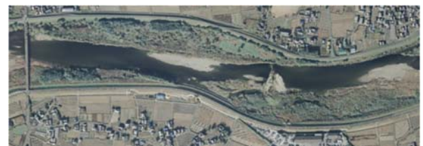
(b) 2007年11月