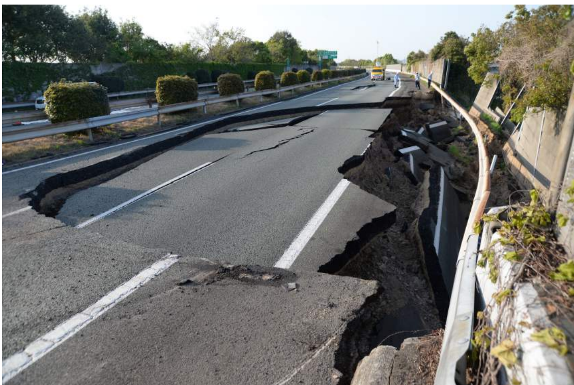
九州自動車道 益城町（秋津川）付近の盛土崩壊部