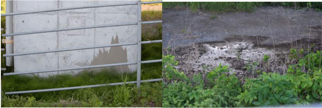
橋脚基部の噴砂痕