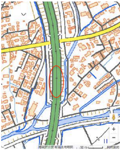
現在の地理院地図