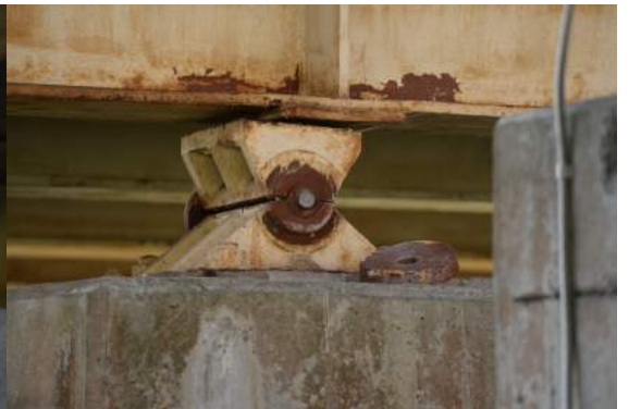
支承部ボルト破断やピン破断・脱落、上沓落下、アンカーボルト抜け出しなど、鋼製支承の様々な被害事例を確認。