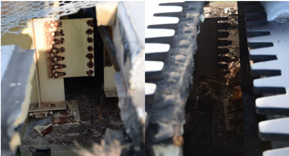
桁連結部もボルト破断によるものや鋼板が破断しているものも。