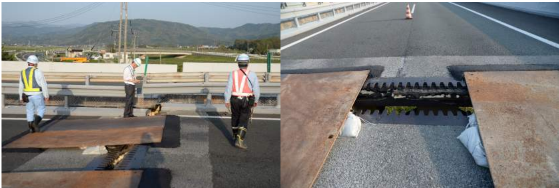
支承部が脱落寸前部の大きな橋面ジョイント部の段差