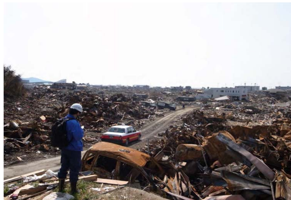
火災調査の状況(石巻:4月10日)