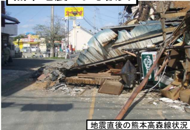
地震直後の熊本高森線状況