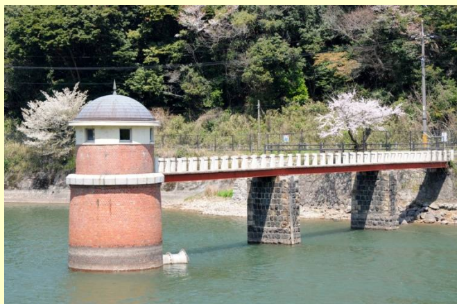
下関市上下水道局 内日第一貯水池取水塔