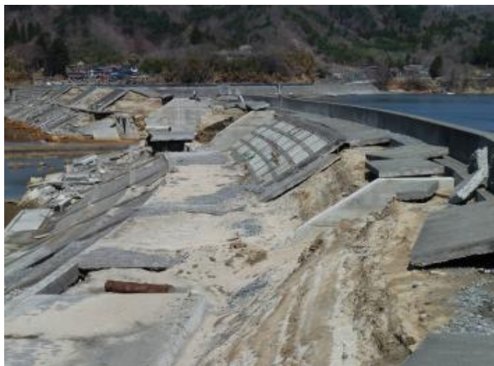
海岸堤防：岩手県宮古市金浜