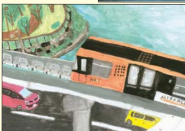
平成23年度 第4回 「身近な土木を描いてみよう!」 図画コンクール優秀作品より