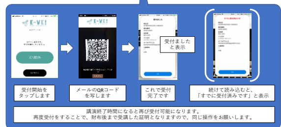
セルフ方式での受付イメージ