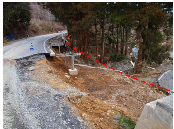
写真-28 被災した歩道構造物（1）