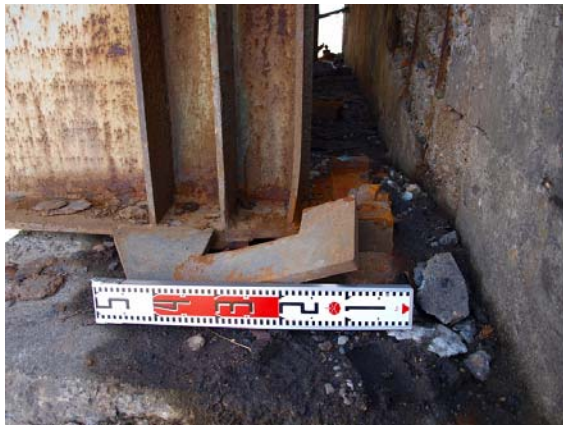
写真-35 橋台の支承損傷状況