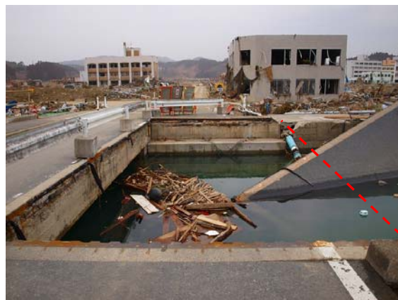
写真-46 南三陸町の落橋した国道橋 (2)