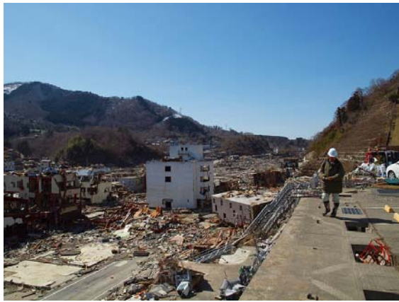
写真-25 町立病院側から女川町を望む(2)