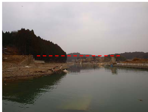
写真-48 気仙沼線の鉄道橋の被害