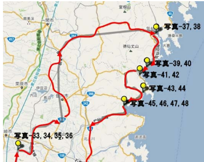
図-5 第5日目の走行ルートと調査位置

図-5 に第5日目に調査を行った走行ルート（赤線）と調査位置（写真撮影箇所）の一覧を示す。写真33～36は志田橋で内陸部であり、これ以外の写真-37, 38は気仙沼中心部を、また写真-39～48は愛宕神社から南三陸町までの海岸線付近の被災地である。