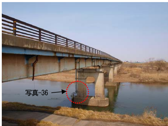
写真-33 志田橋の様子

天童－仙台間はこれまでと同様にバスで移動し、8時30分頃に仙台駅に到着した。仙台駅前でタクシーに乗り換えて、気仙沼方面に向けて移動した。JR古川駅から約5km程度、大郷町方面に位置する志田橋（写真-33）では、写真-34に示す様に右岸側の堤防と道路盛土に大きな被害が発生している。また写真-35に示す橋台の鋼製支承はアンカーボルトのせん断破損などの被害が発生し、約30cmの相対残留変位が確認できる。なお写真-36は橋脚基部の様子を示しているが、曲げひび割れが確認できる程度であり軽微な損傷であった。初日の調査で車両からの走行調査で確認した程度であるが、この志田橋の北側約3kmの北浦地区の住宅も倒壊が何棟か確認されていること、堤防の盛土の滑りを踏まえるとこの周辺の地盤が軟弱であることが影響している可能性が高い。