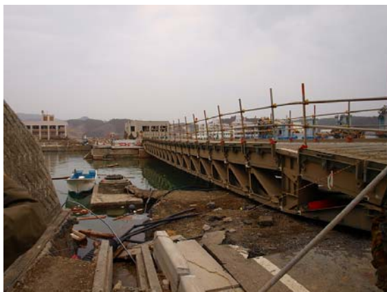
写真-47 国道 45 号の仮橋の様子