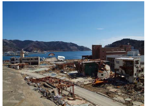
写真-24 町立病院側から女川町を望む(1)