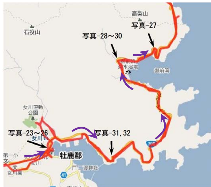
図-4 第4日目の走行ルートと調査位置

図-4 に第4日目に調査を行った走行ルート（赤線）と調査位置（写真撮影箇所）の一覧を示す。写真23～26は女川町の中心部、写真-27～30は御前浜周辺の国道398号、また写真-31, 32は崎山展望公園である。