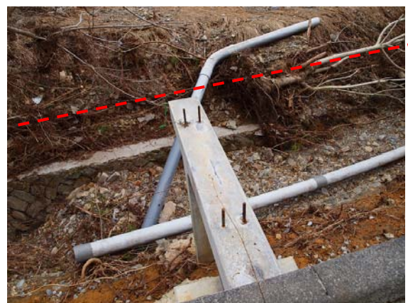
写真-30 下部構造の橋座付近