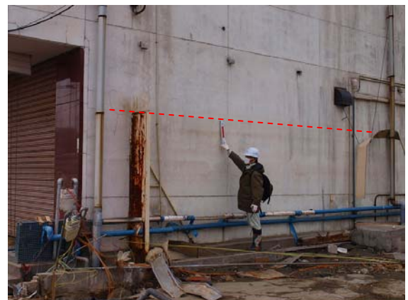
写真-38 津波の痕跡高（気仙沼市内）