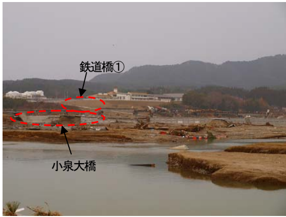
写真-41 小泉地区の橋梁等（国道・鉄道）の被害状況