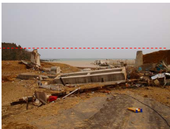
写真-39 愛宕神社付近の鉄道橋の被害 (1)