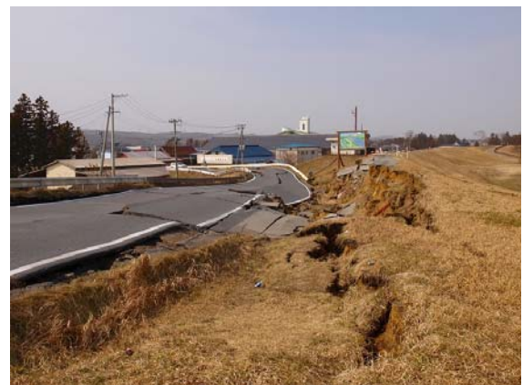
写真-34 志田橋周辺の堤防と道路盛土被害