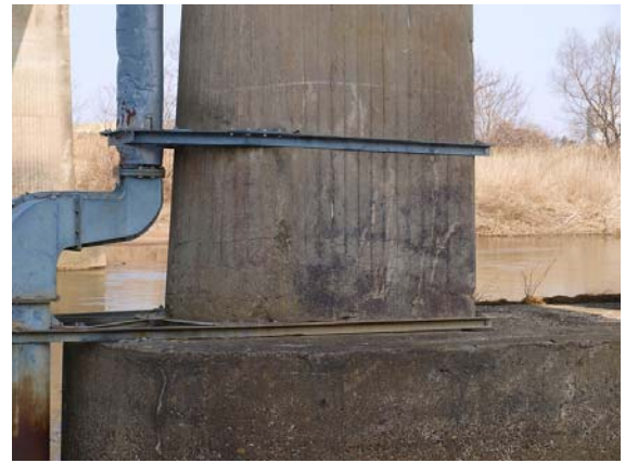
写真-36 橋脚基部の様子