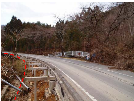
写真-29 被災した歩道構造物（2）