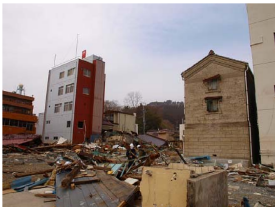
写真-37 気仙沼市街地の様子

気仙沼へは、JR 大船渡線と平行に位置する国道 284 号を經由して移動した。気仙沼では、港内にある船舶に火災の痕跡が確認された。また今回調査を行った別の地域よりも流出した住宅の木材などの処理が早く実施されたように感じた。写真-37 に漁港に近接する気仙沼市街地の様子を示すが、木造住宅や店舗は津波により損傷を受けて多くは流出しているが、奥側にあるような鉄筋コンクリートや石積造には大きな被害は認められない。なお石積造の建築物はその他の場所にもいくつか確認されたが、外部からは大きな損傷が確認出来なかった。また写真-38 に津波の痕跡を示すが、漁港周辺では基礎面（地盤面）からの津波痕跡高さは概ね h=2.0\text{m}\sim 2.5\text{m} 程度であった。