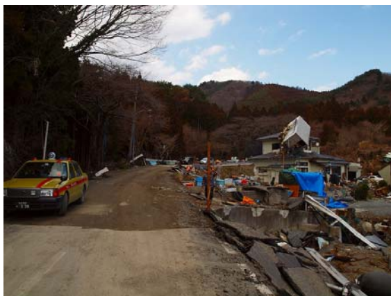
写真-27 津波により洗掘した道路盛土（応急復旧後）

女川町から国道 398 号を北上し、御前湾に位置する御前浜とその周辺の津波被害状況を確認した。写真-27 に津波により洗掘された盛土部、写真-28, 29 に歩道の鉄筋コンクリート構造物（橋梁形式）の被害状況を示す。現地の住民からの情報によると、写真-27 に示す道路盛土は、津波で越流した後に引き波によって洗掘された様であり、現地調査時は応急復旧により車両の通行が可能となっていた。また写真-28, 29 に示す橋梁形式の歩道構造物は、プレキャスト製の上部構造であり津波により流出していた。写真-30 に下部構造の橋座付近を示すが、アンカーボルトにはせん断や曲げによる変形を受けた痕跡を確認することができないため、津波の揚力により浮き上がり、その後流出したものと想定される。