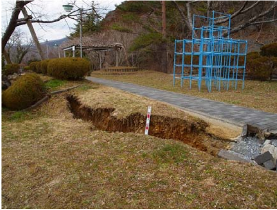
写真-31 崎山展望公園の地盤被害(1)

御前浜周辺から女川町中心部に戻る途中に位置する崎山展望公園の被災状況を確認した。写真-31, 32 に公園部の地盤被害の様子を示す。この被害は本震もしくはその直後に発生した規模が大きい余震による地震動で被災したものを考えられるが、地表面に大きなテンションクラックが認められた。また写真-32 の中央にある外灯のような施設は、塔の先端が海側（写真の左側）に大きく傾いていることが認められるように、この公園では比較的大きな地盤滑りが発生した。この国道 398 号では路面に亀裂が発生している箇所がいくつか確認されている。