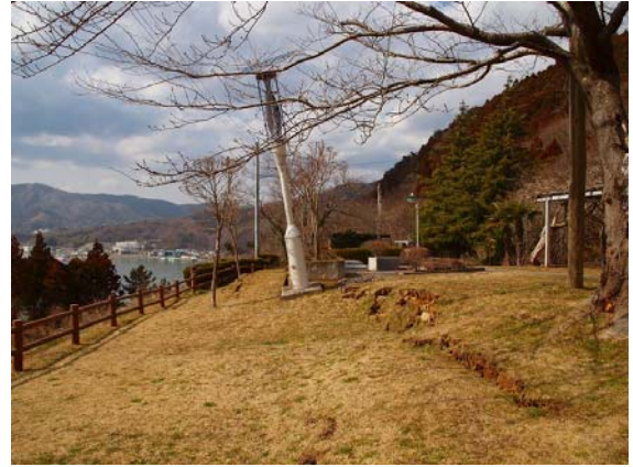
写真-32 崎山展望公園の地盤被害(2)