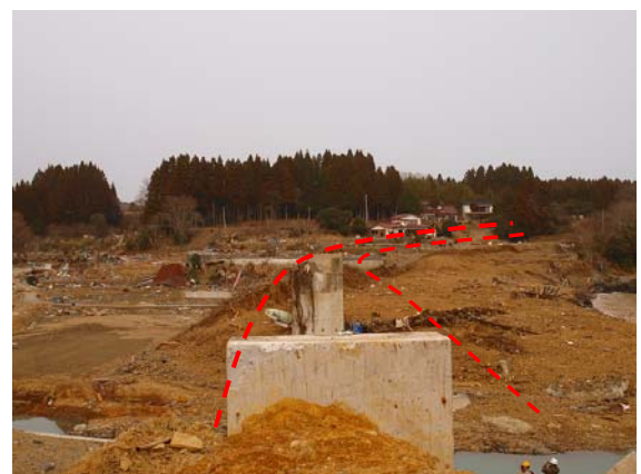
写真-40 愛宕神社付近の鉄道橋の被害 (2)