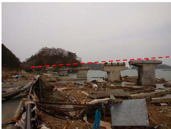
写真-43 歌津地区の落橋した橋梁（国道）

陸前小泉地区から南側に約 5km の位置にある歌津地区も甚大な被害が発生している。写真-43 は歌津地区の海岸線付近に位置する国道 45 号の橋梁であるが、多くのスパンで落橋が確認された。この橋梁は耐震補強工事が行われていたため、橋脚柱部は目視する限りでは大きな損傷は認められない。しかし橋座面に着目すると変位制限装置（鋼製）が確認できるが、津波が押し寄せてきた側は大きな変状はないものの、その反対側のみ変状が確認できる。さらに橋脚によっては橋座面にコンクリートの損傷が認められた。このことから、津波波力による水平力に加えてかなりの上揚力が発生し桁が面外方向に回転を伴いながら流出したと推測できる。写真-44 は写真-43 で示した橋梁から山側を望んだものであるが、鋼製桁で比較的桁下余裕がないこの橋梁は、津波により流出したような痕跡は認められなかった。