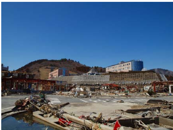
写真-23 港側から望む町立病院

天童－仙台間は前日と同様にバスで移動し、8時30分頃に仙台駅に到着した。仙台駅前でタクシーに乗り換えて、女川方面に移動した。女川町は宮城県牡鹿半島の基部（仙台から約60km）に位置している。女川町に到着後、町立病院の駐車場から女川町全体の被害状況を確認した。写真-23は港側から病院側を撮影したものであるが、この町立病院は4～5階建てのビル相当の高さに建設されている。写真-24, 25はこの病院駐車場から撮影した町全体の津波被害状況を示したものであるが、多くの木造住宅は津波により倒壊・流出している。また、鉄筋コンクリートや鉄骨構造のビルは津波により被災しているが、特に写真-26に示す鉄筋コンクリート製のビルは津波により転倒したと考えられるが、この被害より女川を襲来した津波波力は極めて大きいことを示している。なおこの地区の鉄筋コンクリート製のビルの開口部（窓）とその周辺の壁を確認したが、せん断クラックが発生していないため、地震動により損傷した可能性は低いものを想定される。