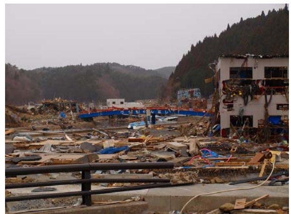
写真-44 歌津地区の被害状況