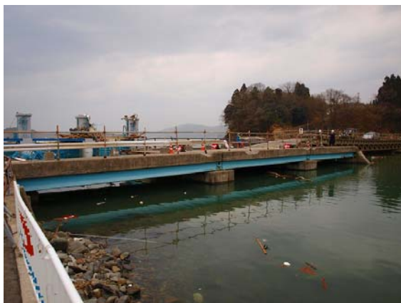
写真-45 南三陸町の落橋した国道橋 (1)

また、この橋梁の右岸側は津波により大きな洗掘が発生しており、この被害により国道 45 号は地震発生から約 1 週間程度通行止めとなっていたが、鋼製（トラス形式）の仮橋により片側交互通行ではあるが車両の通行が可能となった。その仮橋の様子を写真-47 に示す。写真-48 は国道 45 号の仮橋側から上流側に位置する鉄道橋の被害を撮影したものであるが、これらの被害は、上部構造の落橋をはじめ取付盛土の洗掘など、同日に調査した愛宕神社近くに位置する被害（鉄道橋として類似した被害）と同様な傾向であることが認められる。