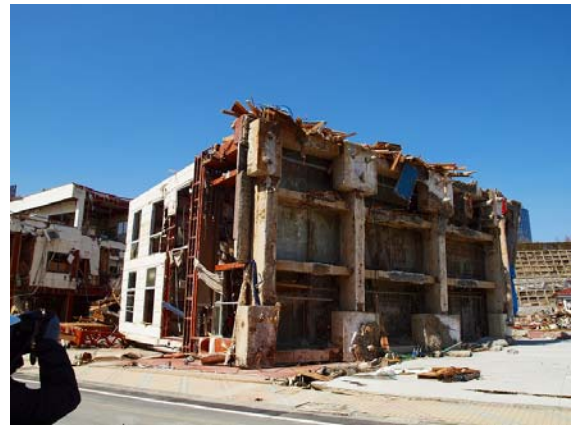
写真-26 津波により転倒したビル