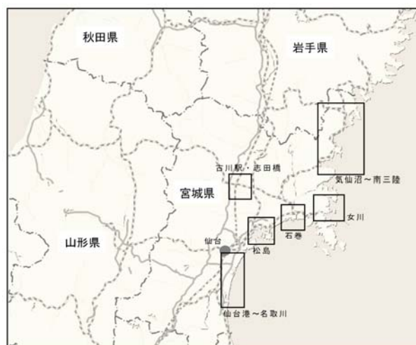
図-1 調査対象地区の全体位置図