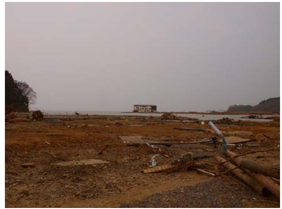
写真-42 小泉地区の海岸線付近の被害状況